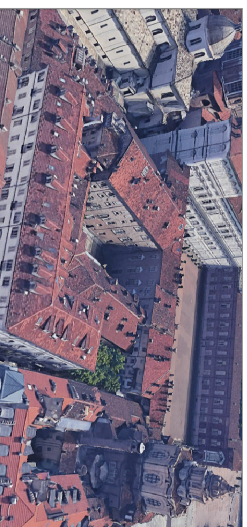
VEDUTA AEREA SU VIA XX SETTEMBRE